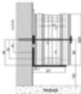
Kamer KD - Yan İnce Görünüş

Her bölme için standart ölçüler için her bölme için farklıdır.